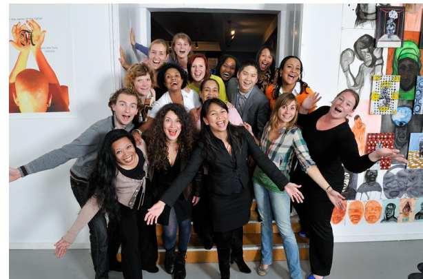
Atana Cultuur Ronde 17 tijdens de aftrap op Prinsjesdag.

course voorbereiden op en matches met raden van toezicht in de culturele sector. Een opmerkelijk punt uit de beschikking is dat atana wordt aangemerkt als cultuurproducerende instelling. Daarom zal over de gehele nieuwe planperiode een korting op de subsidie plaatsvinden. Dit gebeurt naar aanleiding van het rapport Cultuurprofijt dat ervan uitgaat dat instellingen meer eigen inkomsten moeten generen. Dit rapport doelt echter op instellingen voor de podiumkunsten en musea, en niet op programma's als atana waarbij het opstuwende bestuurlijk talent centraal staat.